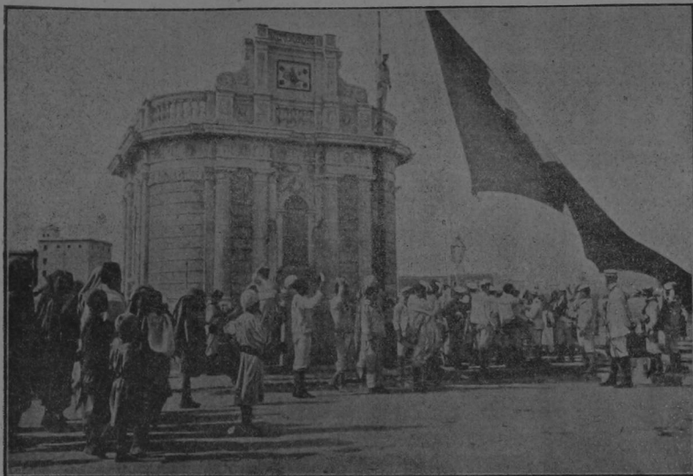
Solemne acto de izar la bandera de Italia en la gran fontana central de la ciudad de Trípoli