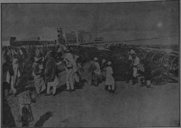
Gran cantidad de artillería moderna abandonada por los turcos en Trípoli, al retirarse de esa ciudad cuando fué ocupada por las tropas de Italia